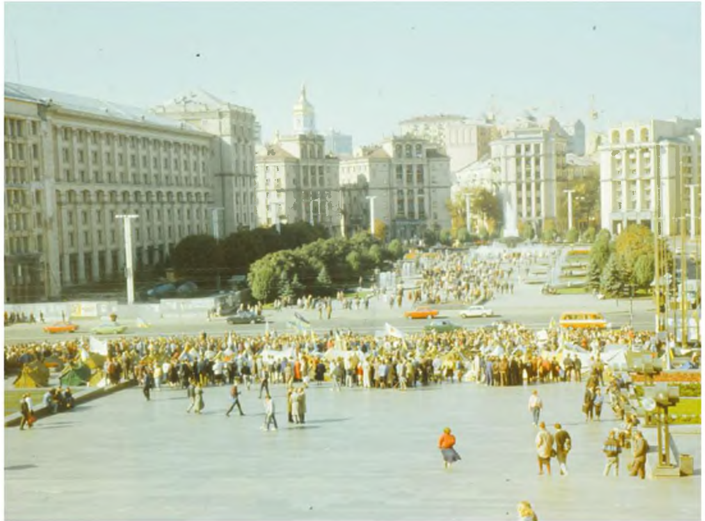
Вигляд табору протестувальників.

Після цього протест, який до того називали Студентським голодуванням на граніті, отримав назву «Революція на граніті».