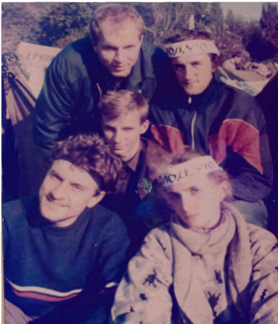
Голодуючі студенти у білих пов'язках та охоронець табору із чорною пов'язкою на голові.