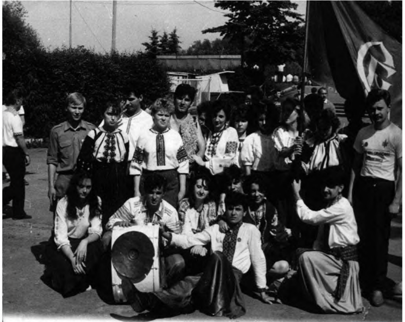
Учасники Студентського братства Львова.

Студентське братство Львова налагодило контакти з іншими українськими студентськими об'єднаннями, зокрема Українською студентською спілкою (УСС). На спільній нараді ухвалили рішення розпочати акції протесту на початку жовтня 1990 року.