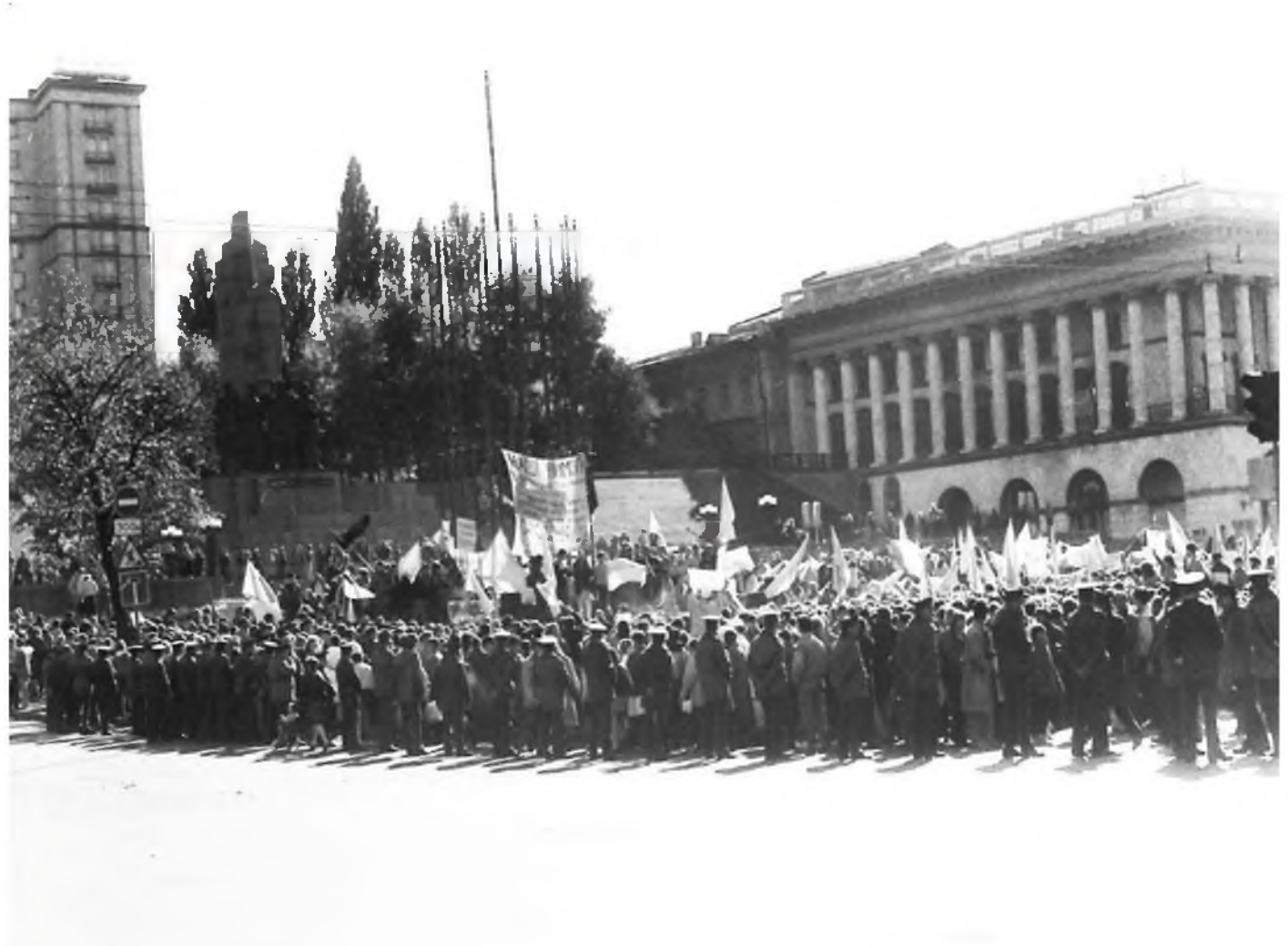
Кордони міліції навколо наметового містечка у середмісті столиці. Вигляд табору протестувальників.

На стрічці, якою був огорожений табір, протестувальники повісили аркуш з написом «майдан Незалежності».