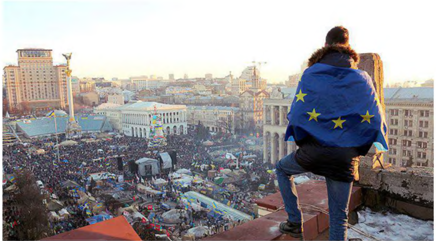
Євромайдан / Революція Гідності.

Сформовано покоління активістів, які продовжили громадянську та політичну діяльність у незалежній Україні та стали активом наступних Майданів: Помаранчевої революції та Революції Гідності.