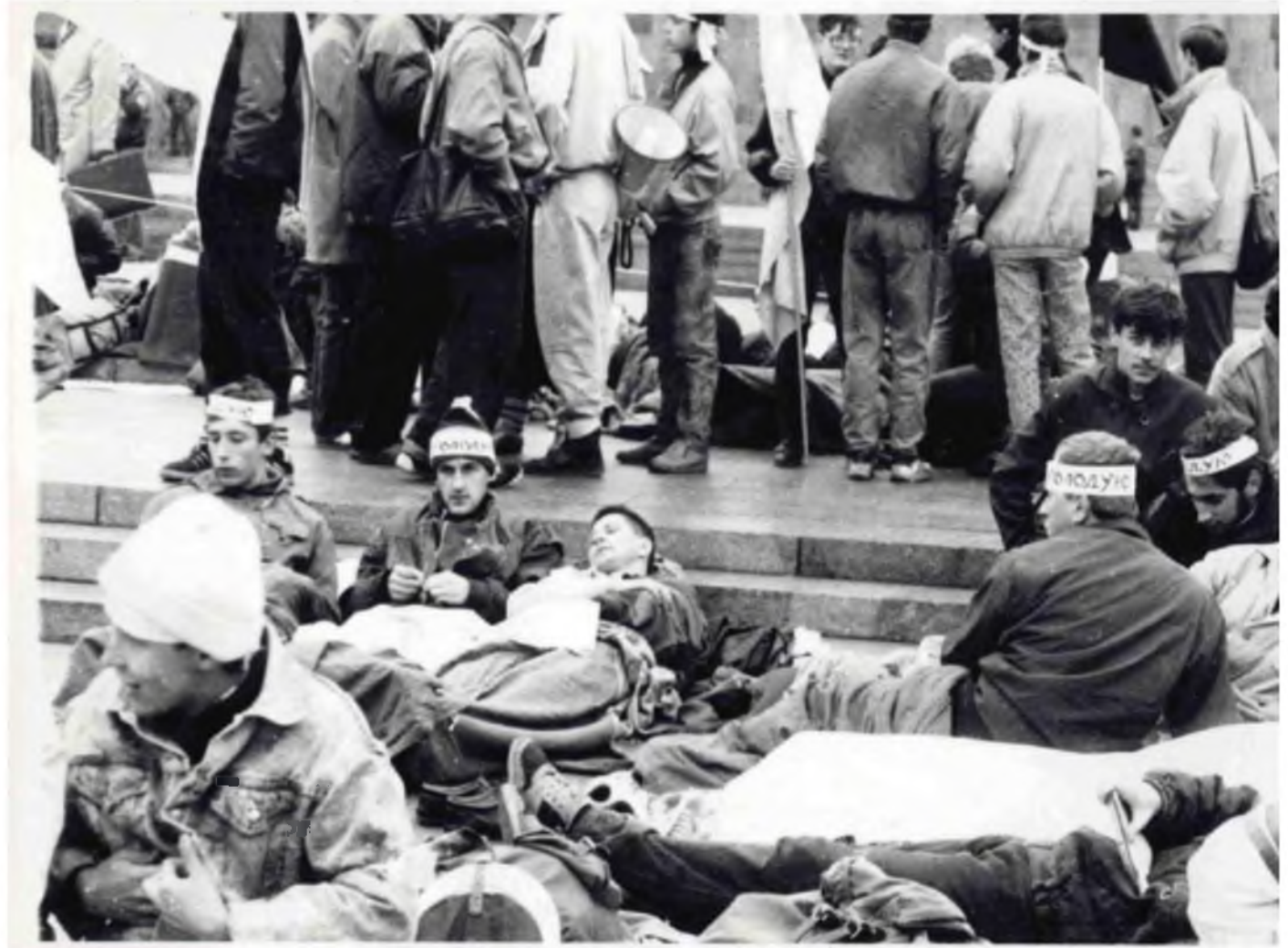
Перший день голодування.

Акцію планували провести під будівлею Верховної Ради. Проте вранці 2 жовтня загони міліції оточили споруду. Частина мітингувальників, які вийшли на площу Жовтневої революції, вирішили розпочати протест там. Увечері на головній площі Києва з'явилося наметове містечко.