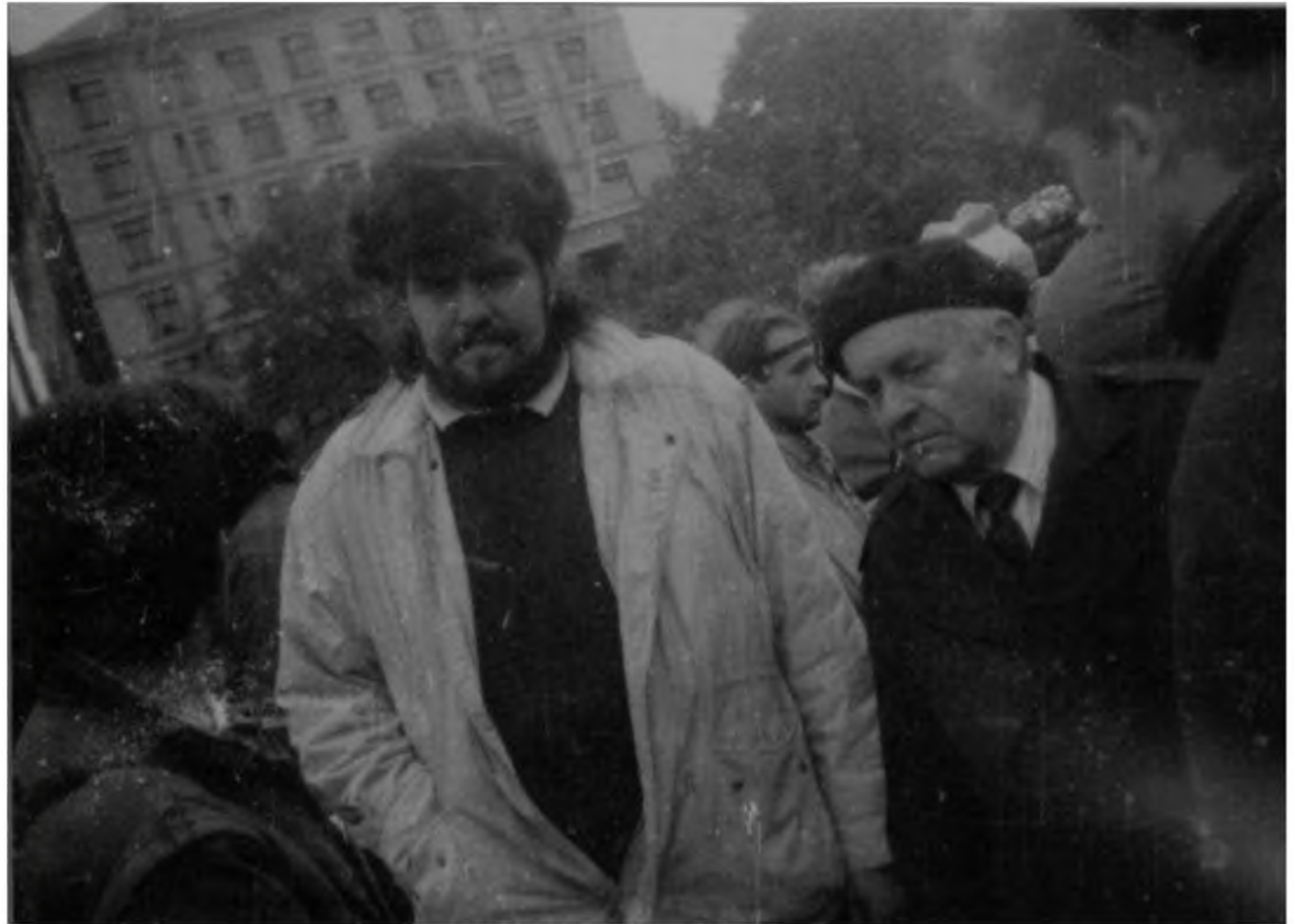
Голова СБЛ Маркіян Іващишин і поет, народний депутат СРСР від демократичних сил Ростислав Братунь у студентському наметовому містечку.