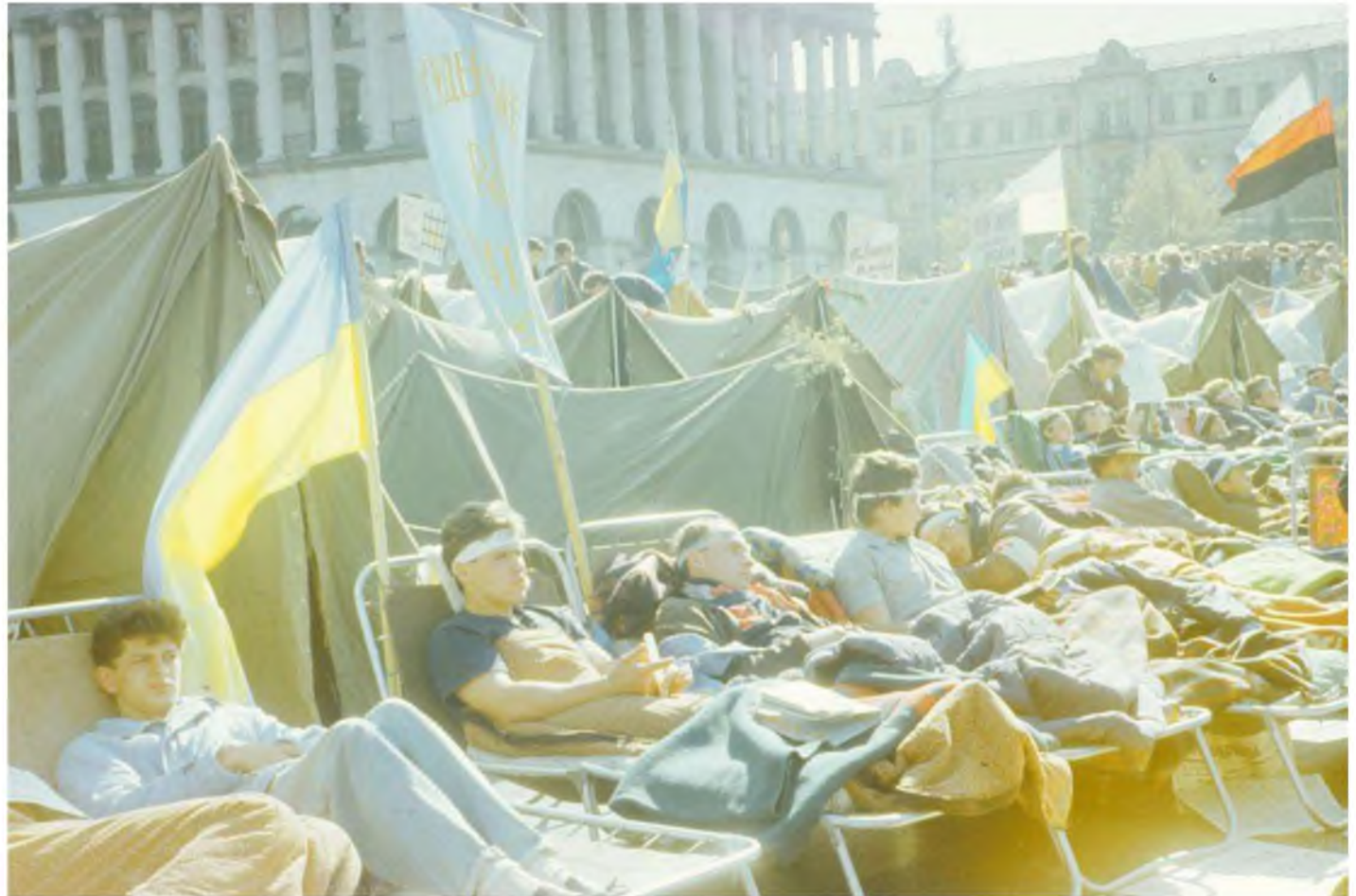
Учасники голодування.

Ще частина учасників носила чорні – ті, хто відповідав за безпеку голодувальників.