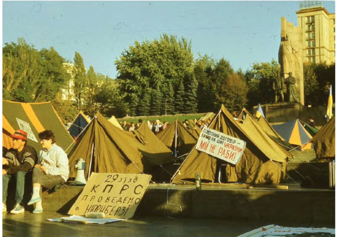
Плакати наметового містечка.