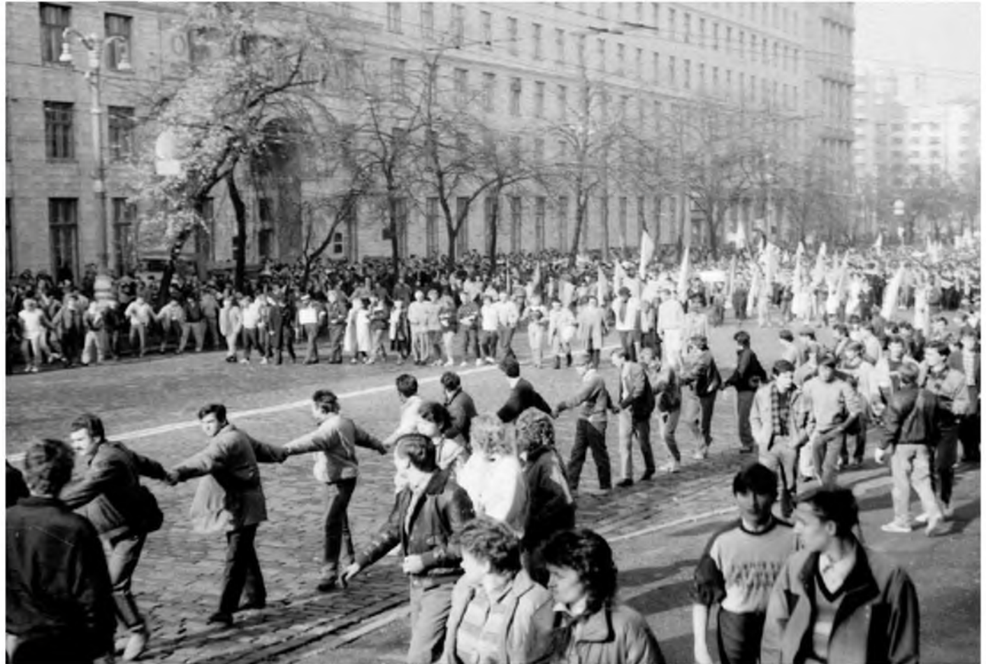
Хода до будівлі Верховної Ради УРСР.